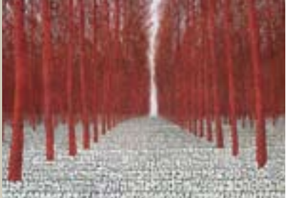
Foresta degli Elementi di TOBIA RAVÀ

FONDAZIONE CARIGO - Sala "Della Torre" via Carducci 2